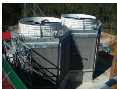
Terras de Santa Maria Португалия — Hexacool для биомассовой установки мощностью 35 МВт

Экономичная компактная конструкция с рядом преимуществ по сравнению с обычной А-образной конструкцией.