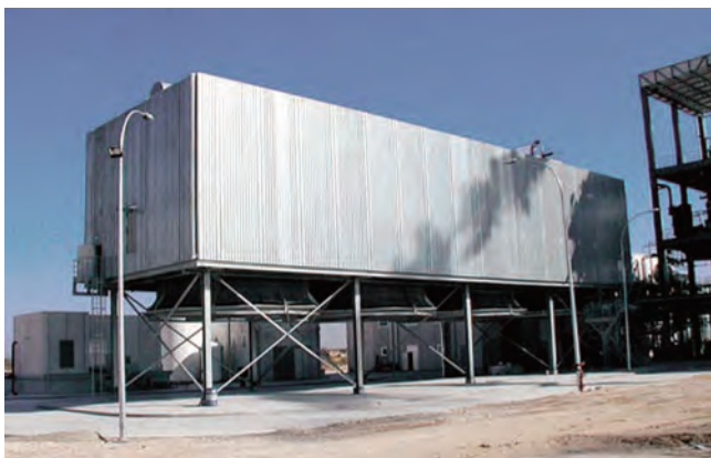
Конденсаторы с воздушным охлаждением для электростанции мощностью 15 МВт, работающей на сухих отходах производства оливкового масла. Испания

Традиционно конденсаторы с воздушным охлаждением имеют А-образную модульную конструкцию и предназначены для использования на энергоустановках мощностью от нескольких мегаватт до нескольких сотен мегаватт. Это решение является самым эффективным для крупных электростанций, где конденсация пара осуществляется воздухом.