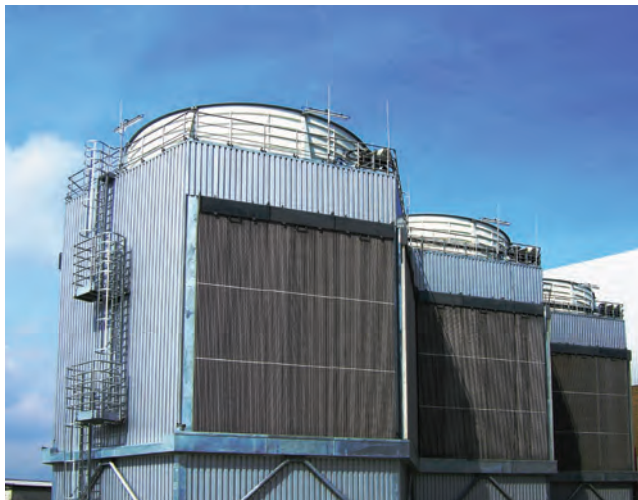
Конденсатор Hexacoil для электростанции мощностью 20 МВт, работающей на биомассе. Эмблиххайм, Германия

Начиная с 1883 года всемирно известные компании Balcke, Marley и Hamon Dry Cooling, образовавшие корпорацию SPX Cooling Technologies, являются лидерами в разработке инновационных решений для систем промышленного охлаждения. Благодаря объединению опыта, SPX добилась мирового признания на энергетических и промышленных рынках. Установив несколько сотен систем сухого охлаждения, имея партнеров и дочерние фирмы на всех континентах, SPX Cooling Technologies является лидером в области инновационных технологий производства конденсаторов с воздушным охлаждением.