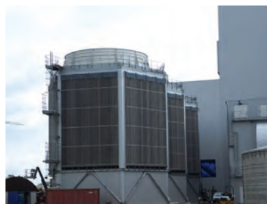
Oostzebeke Бельгия — Hexacool для биомассовой установки мощностью 25 МВт