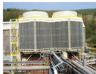
Prayon Бельгия — Hexacool для теплоэлектроцентрали мощностью 15 МВт