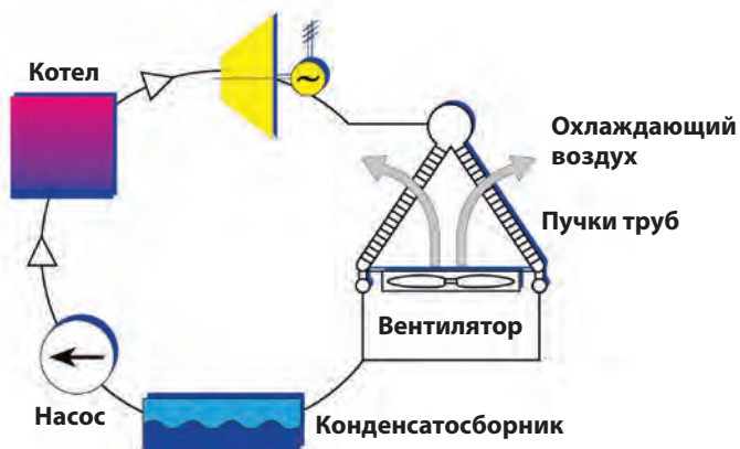
Принцип действия конденсатора с воздушным охлаждением в системе прямого охлаждения

Для небольших энергетических и промышленных установок обычная А-образная конструкция может оказаться не самым экономичным решением. Инженеры SPX Cooling Technologies разработали типовую модульную систему, которая отличается низкой стоимостью, легкостью монтажа и надежностью в эксплуатации.