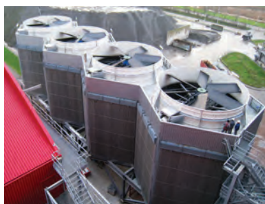
Alkmaar Нидерланды — Hexacool для биоцентрали мощностью 28 МВт